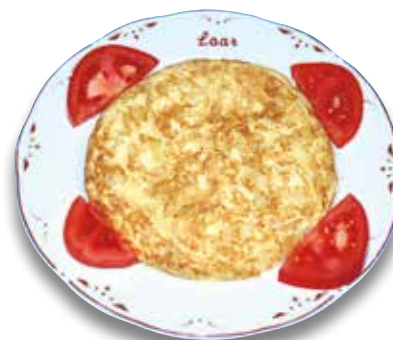
7 Tortilla española 5,80€ Spanish omelette