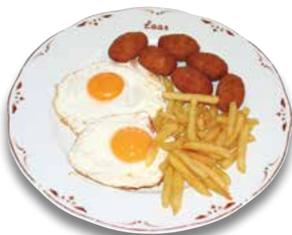
29 Huevos fritos y croquetas de pollo 7,60€ Fried eggs and chicken croquettes