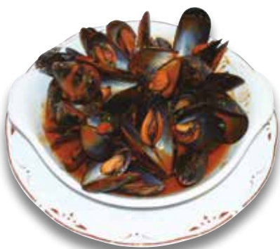
14 Mejillones a la marinera 8,00€ Mussels "a la marinera"