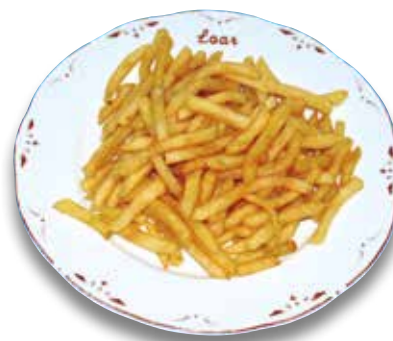
5 Patatas fritas 3,30€ French fries