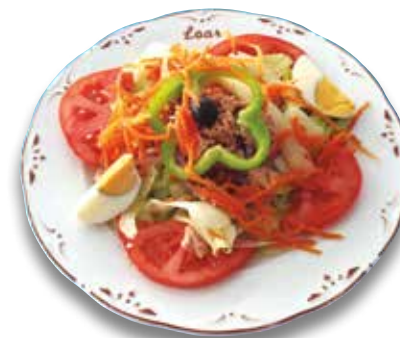
2 Ensalada mixta 6,60€ Mixed salad