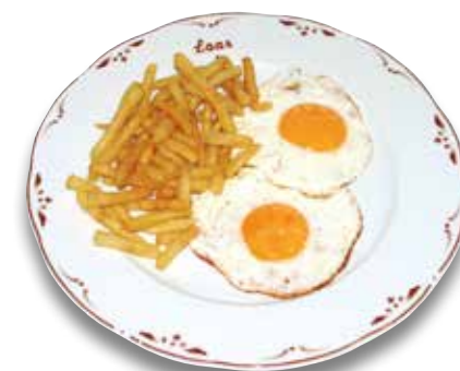
8 Huevos fritos 5,30€ Fried eggs