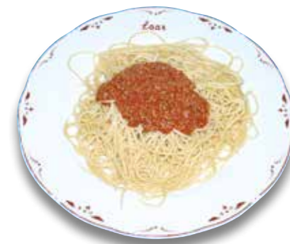
6 Espaguetis a la boloñesa 5,80€ Spaghetti Bolognese