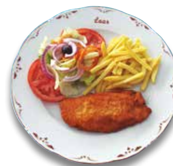
22 San Jacobo de pollo 8,00€ Fried, breaded chicken "San Jacobo"