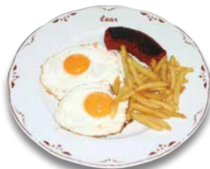
31 Huevos fritos y sobrasada 7,50€ Fried eggs and sobrasada