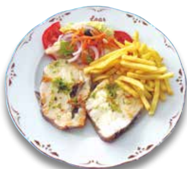
11 Merluza a la plancha 11,50€ Grilled hake