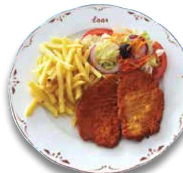
23 Escalope de lomo 8,30€ Pork loin escalope