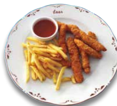
17 Palitos de pollo 7,30€ Grilled chicken breast