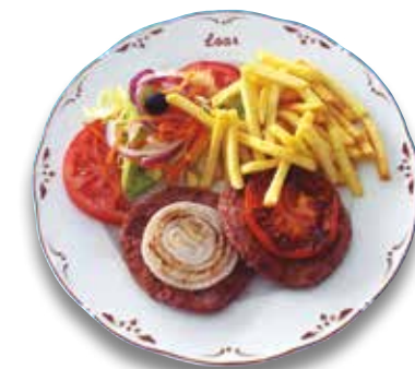
38 Hamburguesa 6,80€ Hamburger