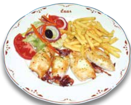
9 Calamar a la plancha 13,50€ Grilled calamari