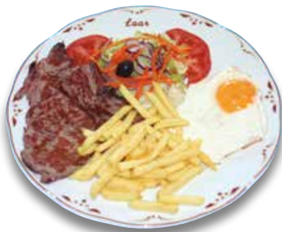
27 Bistec de ternera y huevo frito 10,80€ Beef steak and fried egg