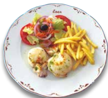
12 Sepia a la plancha 12,50€ Grilled cuttlefish