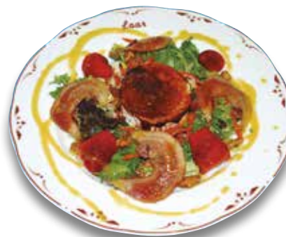
1 Ensalada con queso de cabra 10,00€ Goat cheese salad