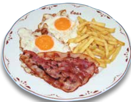
30 Huevos fritos y beicon 7,50€ Fried eggs and bacon