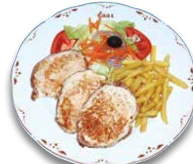
36 Lomo a la plancha 7,80€ Grilled pork loin