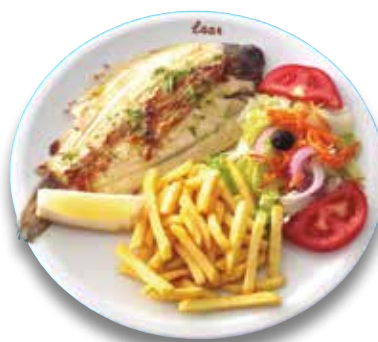
13 Lenguado a la plancha 12,80€ Grilled sole