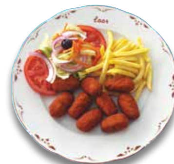
20 Croquetas de pollo 6,30€ Chicken croquettes