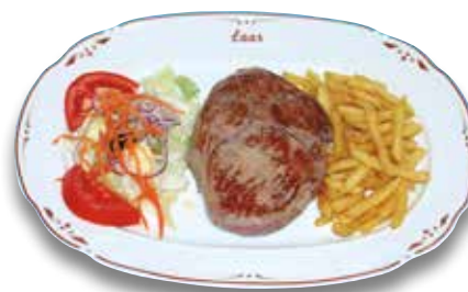
33 Entrecot a la plancha 15,50€ Grilled entrecôte steak