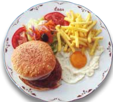
32 Pan de hamburguesa y huevo frito 6,30€ Hamburger and fried egg roll

IVA INCLUIDO Si padece algún tipo de alergia o intolerancia alimentaria, avise al personal.