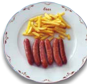
37 Salchichas 6,30€ Sausages