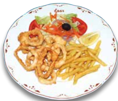
10 Calamar a la romana 13,50€ Fried calamari