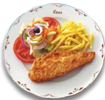
15 Bacalao rebozado inglés 9,50€ English battered cod