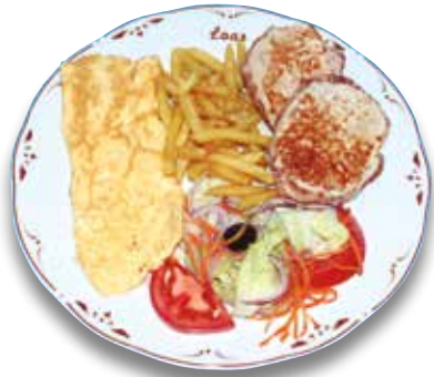
26 Lomo a la plancha y tortilla 8,30€ Grilled pork loin and omelette