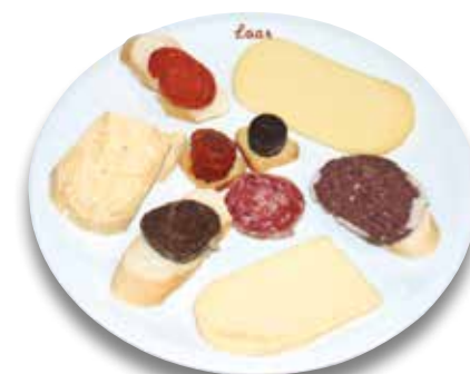
4 Entremeses menorquín 11,00€ Menorcan hors d'oeuvres