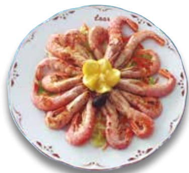
16 Gambas a la plancha 20,00€ Grilled prawns