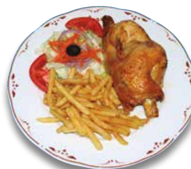
19 Pollo asado 6,60€ Roast chicken