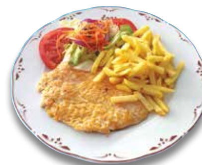
18 Pechuga de pollo a la plancha 6,60€ Grilled chicken breast