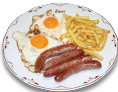
28 Huevos fritos y salchichas 7,80€ Fried eggs and sausages