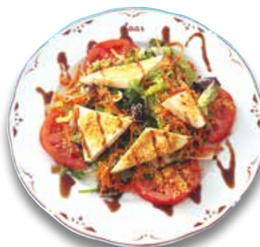
3 Ensalada Loar 8,60€ Loar Salad