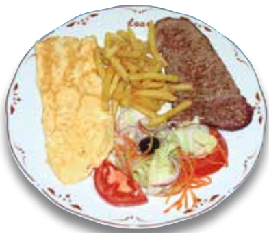
25 Bistec de ternera y tortilla 10,80€ Beef steak and omelette