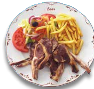
34 Costillas de cordero 10,80€ Lamb chops