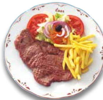
35 Bistec de ternera 9,00€ Beef steak