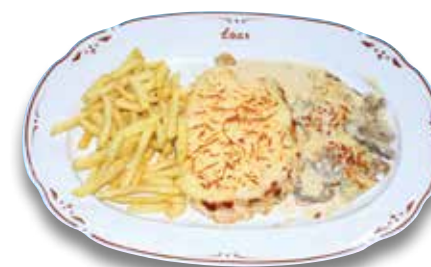
24 Pollo al queso menorquín 9,50€ Menorcan chicken with cheese