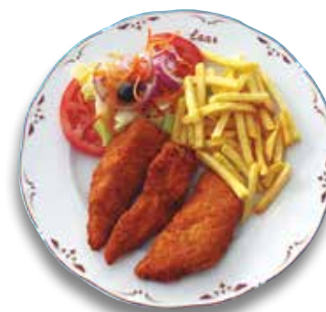
21 Escalope de pollo 8,30€ Chicken escalope